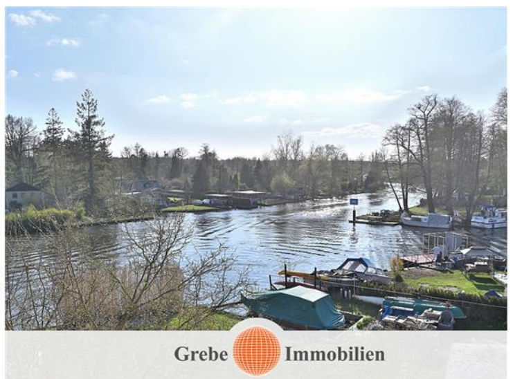
... nach Rechts!