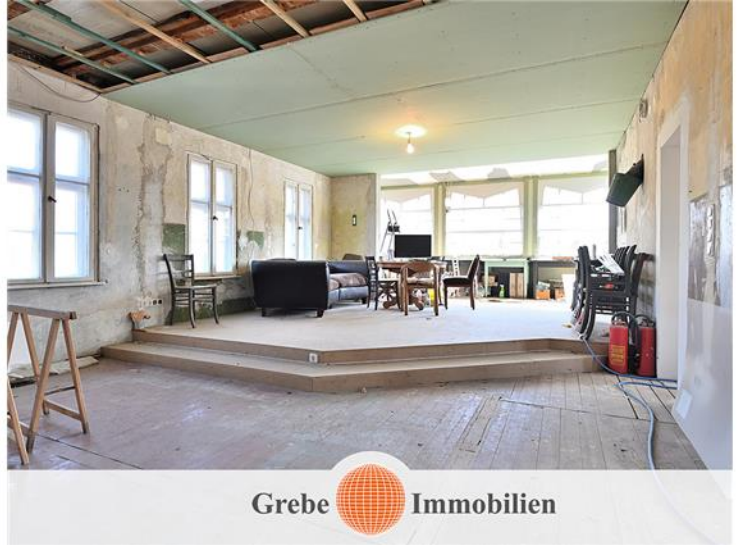
Familienzentrum im OG Bild 2