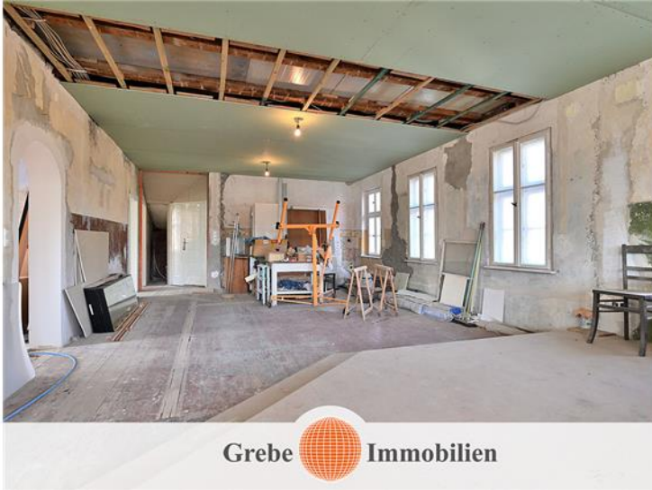
Familienzentrum im OG