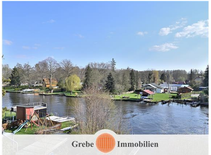
... nach Links ...