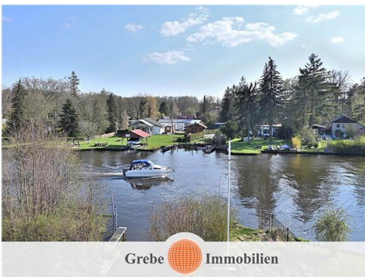
... zur Mitte ...